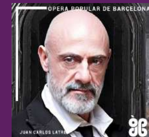
JUAN CARLOS LATRE Juan Carlos Latre